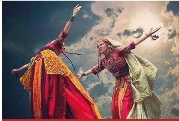
La Cérémonie du Cem en habits traditionnels.

L'Alévisme est une philosophie humaniste vouant un immense amour à l'être humain et à la recherche de la Vérité transcendante (le Hakk). Cette philosophie qui ne se réfère à aucun livre sacré, à aucune révélation, donne une place prépondérante aux arts, à la poésie, la musique et la danse mais aussi à l'approfondissement de la connaissance et des savoirs au respect de la nature. L'alévisme exclut tout fanatisme, tout radicalisme, toute discrimination, tout racisme ; la misanthropie