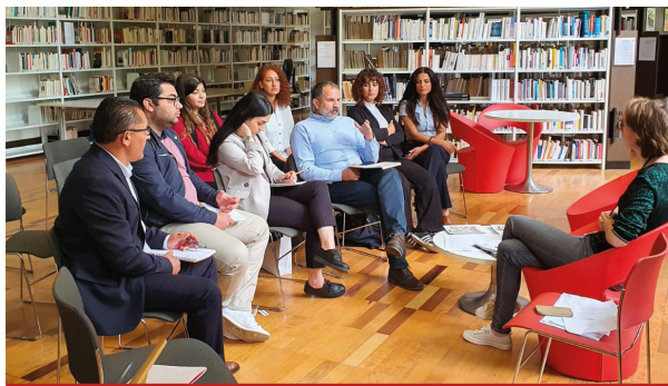
La diplomatie de la FUAF au Musée de l'histoire de l'immigration (2023).

La FUAF a été créée en 1998 et regroupe 38 centres culturels à travers l'Hexagone (association loi 1901 à but non-lucratif). La Fédération a pour but de transmettre les valeurs et la philosophie Alévie : les valeurs républicaines, universelles des droits de l'Homme tout en défendant les principes de partage, de tolérance, de justice, de vivre-ensemble, d'écocitoyenneté et d'égalité entre genres et peuples.