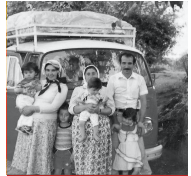
Dans l'adversité, cette courageuse famille alévie se prépare à entreprendre un voyage vers l'exil.